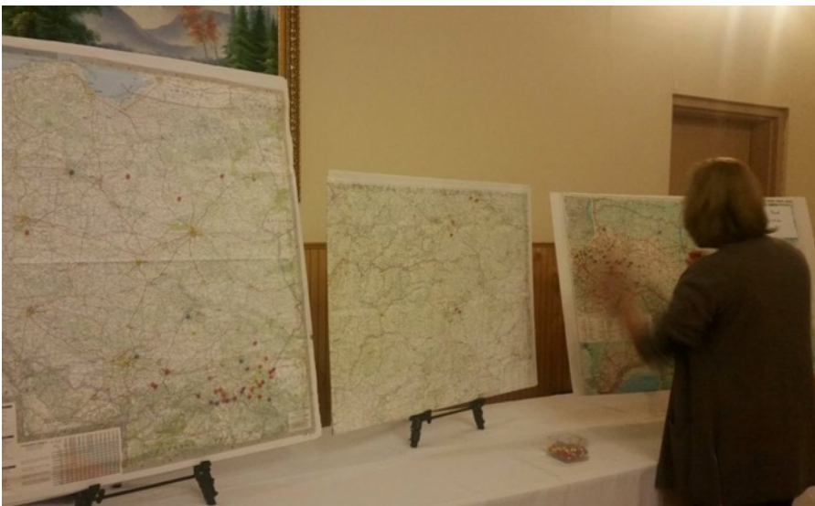
A conference attendee uses a pin to mark the location of her ancestral village on a map.

Наступним заходом програми “Наші Предки” буде віртуальний семінар на інтернеті - 17 березня 2018 року. Деталі будуть подані на веб сайті NashiPredky.org , коли стануть остаточно оформлені.