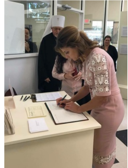
First Lady of Ukraine Mrs. Poroshenko signs the guest book.

Експозиція офіційно відкрилася 4 листопада. Перед тим, учасники конференції генеалогії "Наші Предки", конференції духовенства УПЦ США, зустріч Спілки Української Спадщини Північної Америки та навіть дружина президента України Марина Порошенко отримали унікальну нагоду мати "попередній перегляд" виставки. Виставка буде доступною для огляду до 15 квітня 2018 року.