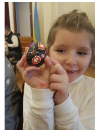
My first pysanka.