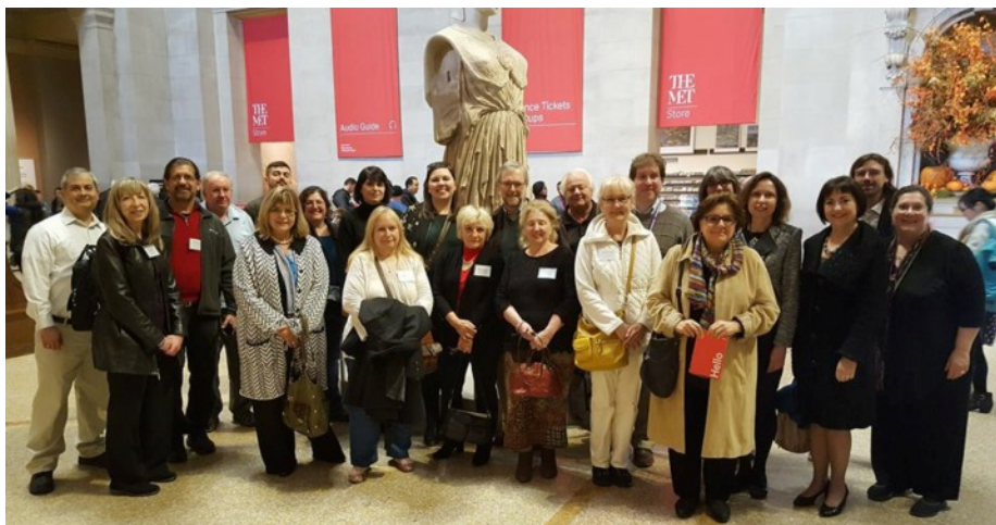
UHNCNA participants at the Metropolitan Museum of Art Учасники конференції Спілки у Музеї Мистецтва Метрополітен

Тема цьогоорічної конференції була "Зберігання і збереження". Однією з найцікавіших подій конференції була - поїздка до Музею мистецтва Метрополітен (Metropolitan Museum of Art) Нью-Йорку на екскурсію до музейного Центру Текстилю ім. Антоніо Ратті, де учасники мали змогу оглянути фондіві сховища центру та лабораторії реставрації музейних артефактів з текстилю. Інші презентації включали такі теми як збереження інших музейних предметів, артефактів і документів на папері, фотографій, та магнетичних звукозаписів.